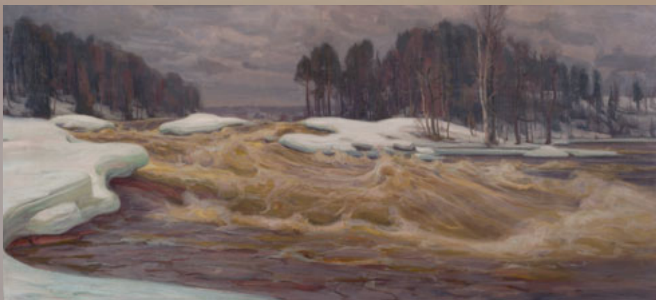
Victor Westerholm Wallinkoski | Wallinkoski fors | The Wallinkoski Rapids, 1914 Enson taidekokoelmat -säätiö | Stiftelsen Ensos konstsamlingar | The Enso Fine Arts Foundation