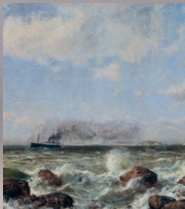
Pekka Halonen Kesäurheilua | Sommarsport | Summer Sports, 1922 UPM-Kymmenen Kulttuurisäätiö | UPM-Kymmenes Kulturstiftelse | The UPM-Kymmene Cultural Foundation